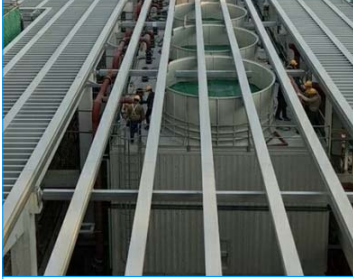
國際金融中心 南京 江蘇 FWS-800-45-GI x 11 FWS-600-22-GI x 3 FWS-400-22-GI x 3