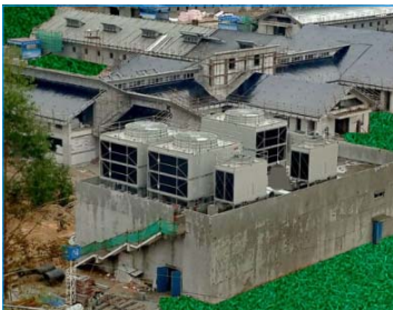
香港賽馬會從化馬場 從化 廣東 FWS-700-37-GI x 3 FWS-127-11-GI x 2