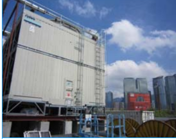
啓德區域冷卻系統 九龍灣 香港