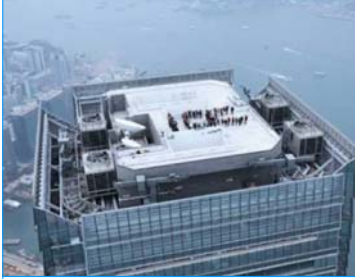
麗斯卡爾頓酒店 西九龍 香港