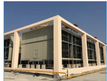
堅基商城 河源 廣東 FWS-800-22-GI x 9 FWS-400-22-GI x 3