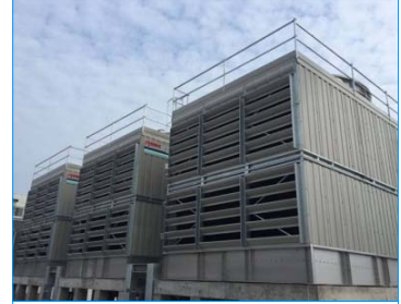
香港數據中心 將軍澳 香港