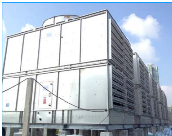
中國移動將軍澳數據中心 香港