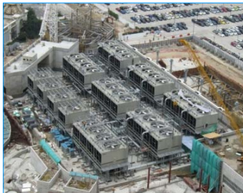
銀河娛樂渡假村二期 澳門