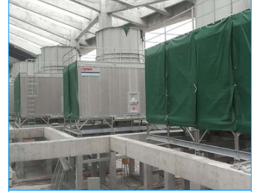
恒隆廣場 昆明 FWS-350-22-SS x 15