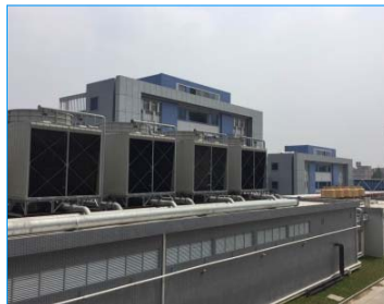
德普特電子廠 東莞 廣東 FWS-500-22-GI x 7