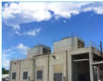
Agana 購物中心 塞班島 FWS-500-22-GI x 3