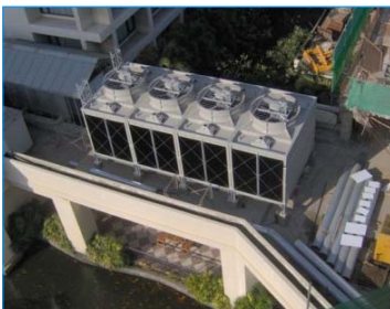
Asian 酒店 斯里蘭卡 FWS-169-7.5-GI x 4