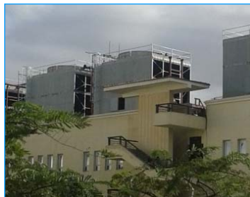
科技大學 開羅 埃及 FWS-800-45-GI x 4