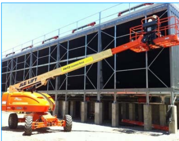
石橋牌輪胎廠 北卡羅來納州 美國 FWS-800-22-GI x 5