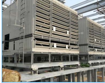
港珠澳大橋旅檢大樓 珠海 廣東 FWS-700-37-GI x 7