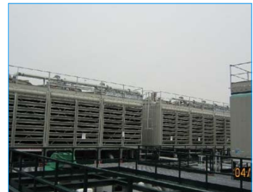
賽馬會沙田馬場區域供冷系統 香港