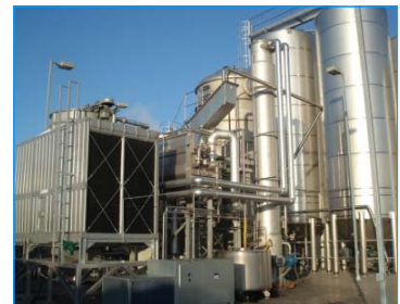
紅酒廠 智利 FWS-169-15-SS x 1