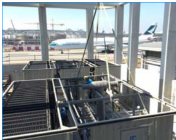
香港國際機場中庭客運廊 香港