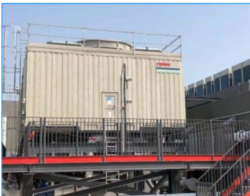
香港航空訓練中心 機場 香港