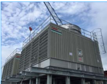
養和醫院東區醫療中心 香港